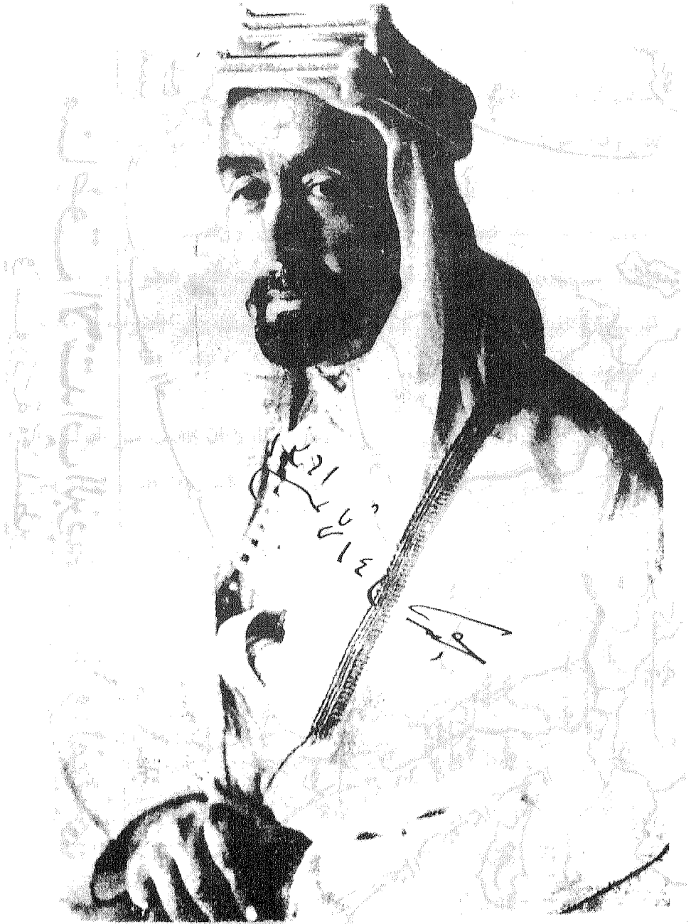
الأمير عبد الله بن الحسين